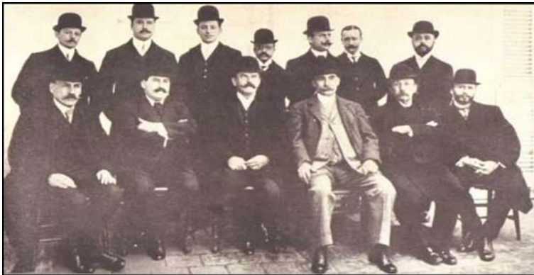
Fig 2: Hospital "San Roque" – Buenos Aires – 21 de Agosto de 1907.

Fundación de la "Sociedad Dermatológica Argentina".